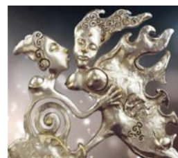
Concert de l'Avent Le Songe d'Orphée